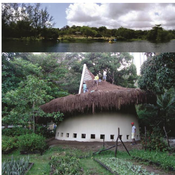
Figura 02. Implantação geral do projeto vencedor de requalificação do Parque Arruda Câmara, vista panorâmica do lago dos pedalinhos e oca.