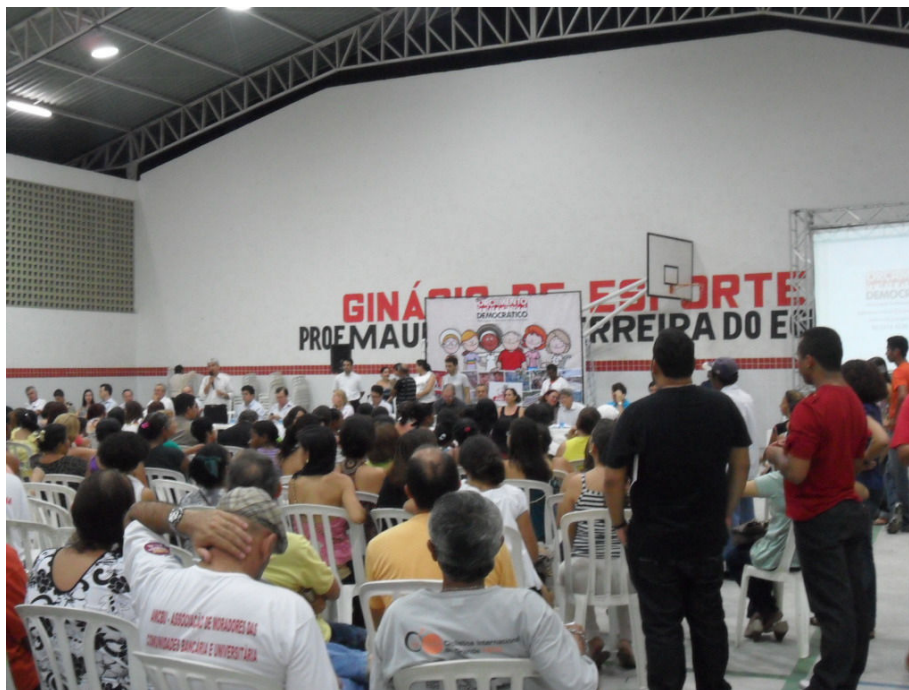
Figura 01. Assembléia da 14ª regional, em 7 de abril de 2011, no ginásio da Escola Municipal Olívio Ribeiro Campos, Jd. Cidade Universitária.

algum fundamento, é necessário um estudo mais aprofundado sobre os efeitos positivos ou não no entorno e na eficácia dos investimentos. Se este estudo é realizado, há pouca informação a respeito, ou seja, há pouca transparência na evolução dos processos.