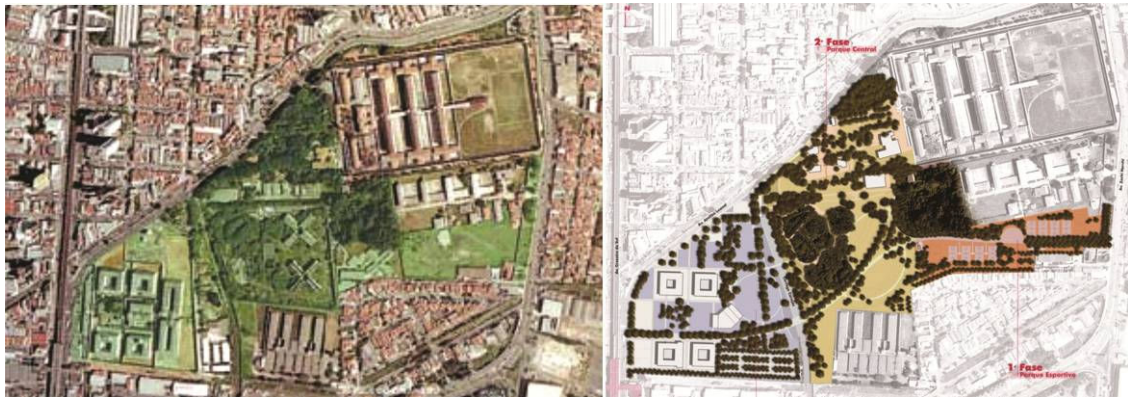
Figura 03. Parque da Juventude-SP. Vista aérea antes da intervenção e anteprojeto à direita.

Obra: Parque da Juventude - São Paulo-SP. Projeto: Escritório do arquiteto Gian Carlo Gasperini, com o paisagismo da arquiteta Rosa Grena Kliass e equipe. Área total: 25 ha. Ano: setembro de 2003 - 1º etapa - setor esportivo.