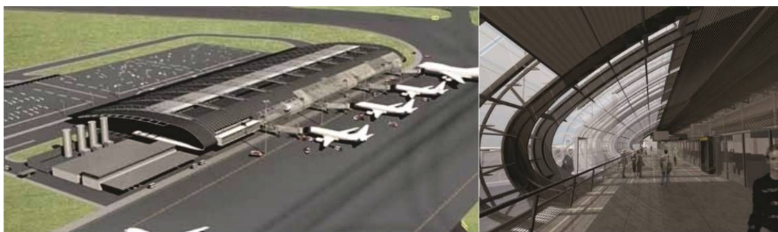
Figura 05. Vista panorâmica e detalhe do saguão.

Obra: Aeroporto de Florianópolis - Florianópolis - SC. Projeto: Arquiteto Mario Biselli e equipe. Área total: 27.400 m 2 Ano: 2004