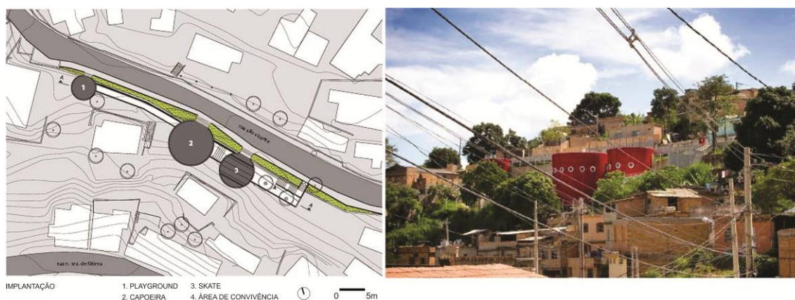
Figura 07. Comunidade da Serra - Belo Horizonte - MG- 2007. Implantação do projeto e volumes vermelhos em destaque na paisagem. Projeto e obra elaborados em contato com a comunidade. Praças públicas multiuso e sob os cilindros oficina de costura, banheiros e vestiários. Exemplo de efeito multiplicador. Arquitetos: Fernando Maculan, Mariza Coelho e Rafael Yanni.

Unir o local ao global como uma sinergia de ações onde o espaço é protagonista para o social e a legislação um instrumento facilitador desse procedimento, poderá ser o caminho para uma cidade mais justa e atraente para todos os moradores. A qualificação dos espaços públicos cumpre um importante papel nesse percurso de consolidação cidadã, na materialização de ambientes construídos mais humanos e democráticos.