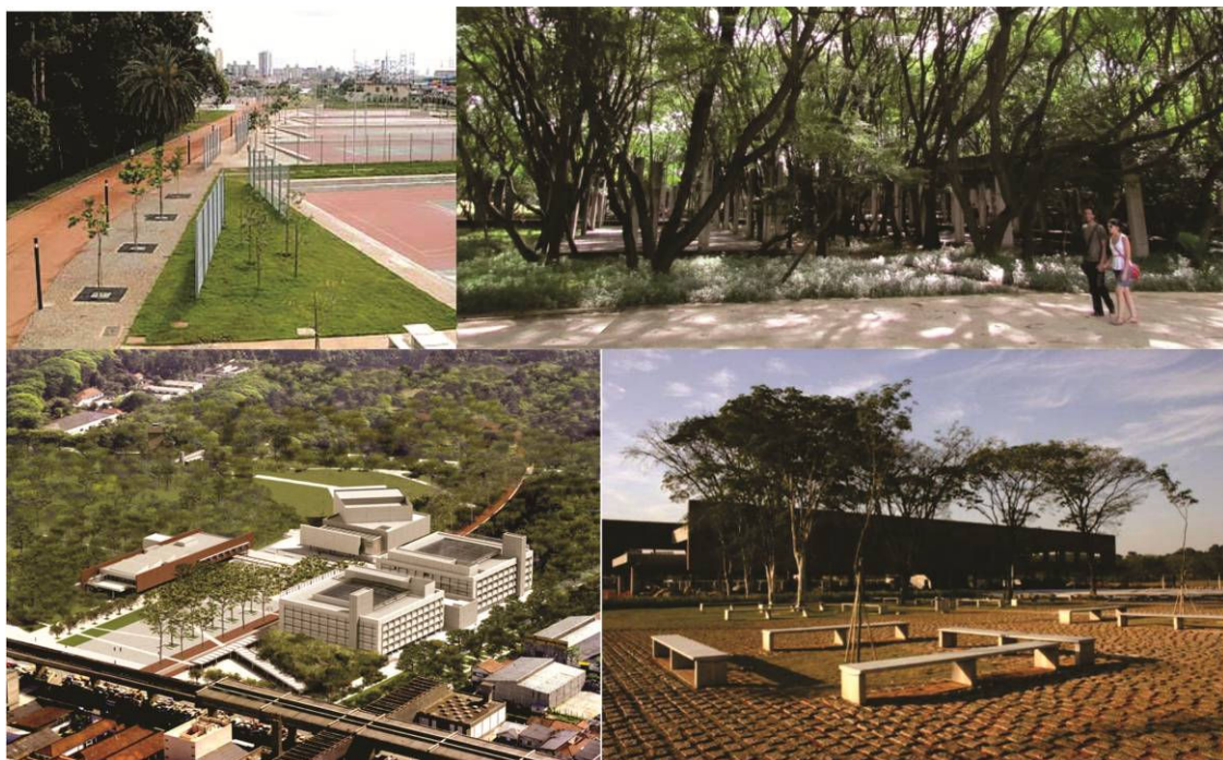
Figura 04. Sentido horário: vista da alameda central e parte das quadras esportivas, arborização na ruína do antigo complexo Carandiru, vista panorâmica do setor institucional, e praça e biblioteca pública ao fundo.